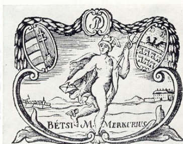
A' R. Tsáfszari és Ap. Királyi Felség' Kegyelmevel Indult BÉTSBÖL Pénzeken 7. Májusban. 1793.